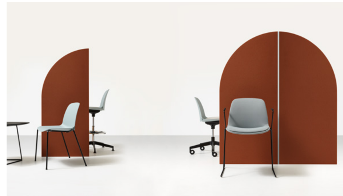
Kire visitor chair / Azzurro - One 8032