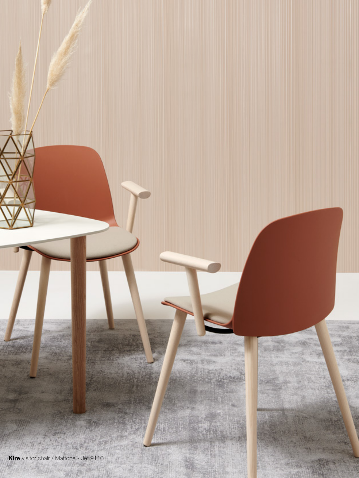
Kire visitor chair / Mattone - Jèt 9110