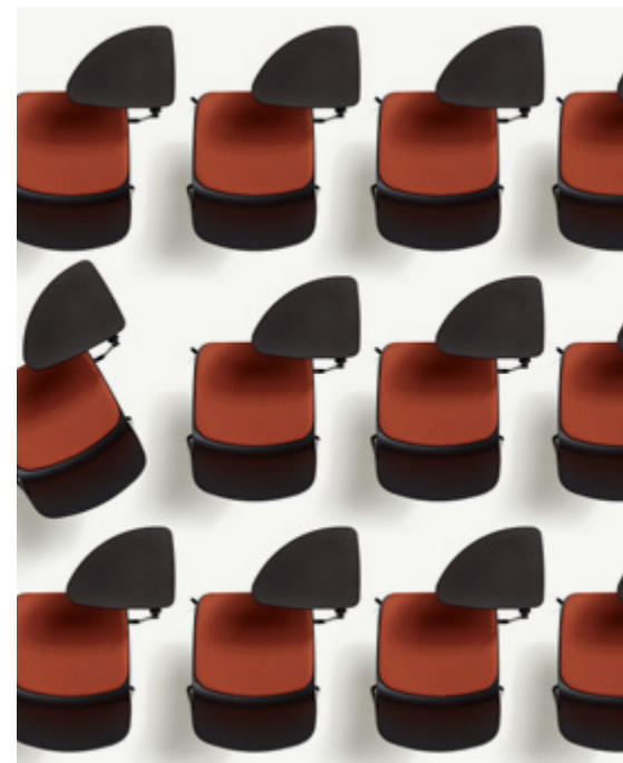
Kire community chair / Nero - One 4566