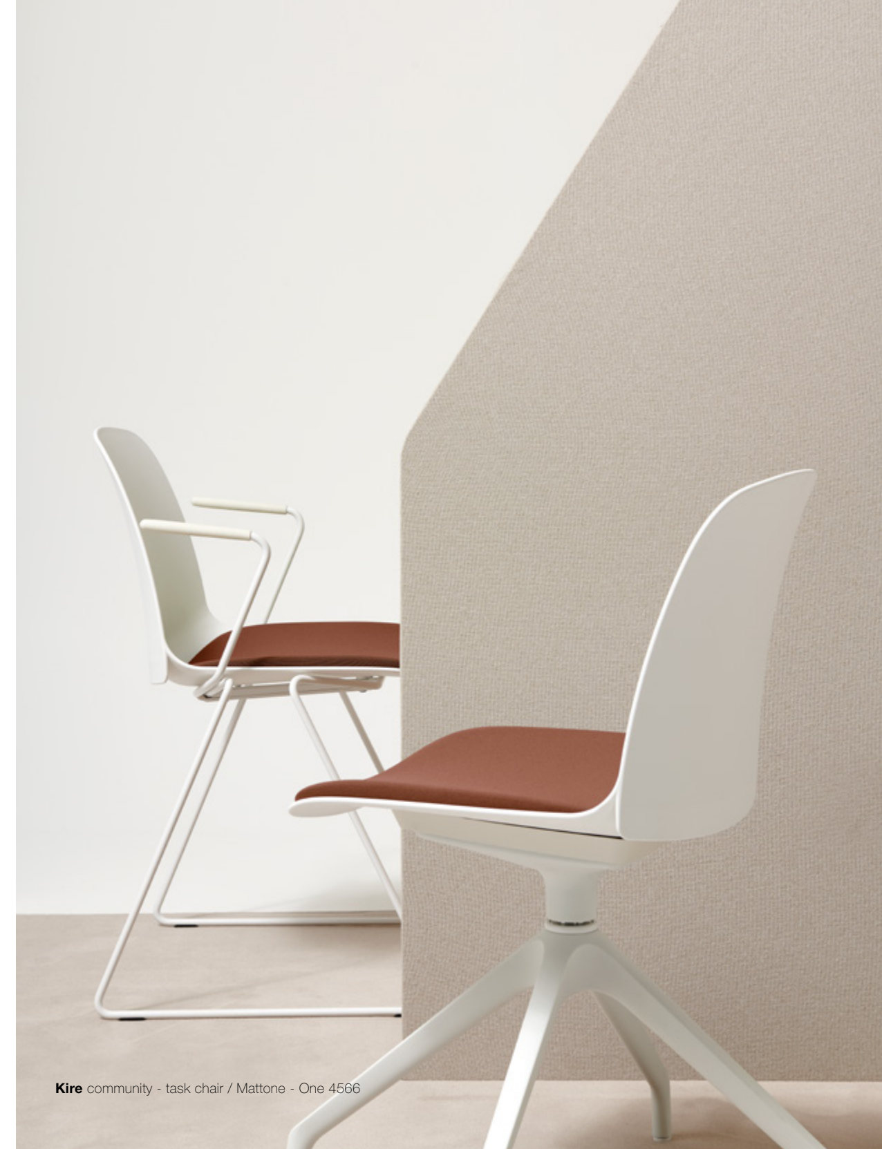
Kire community - task chair / Mattone - One 4566