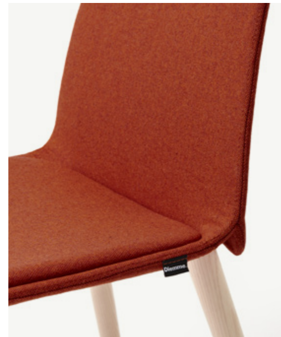
Kire visitor chair / Wolin 7050.36